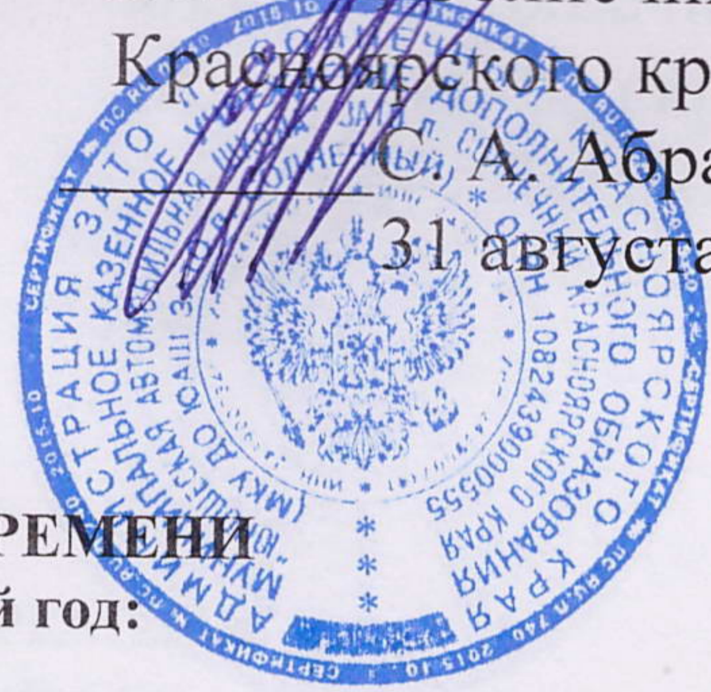
ГРАФИК РАБОЧЕГО ВРЕМЕНИ на 2016-2017 учебный год: